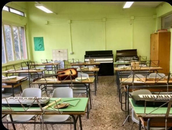
Laboratorio di Musica