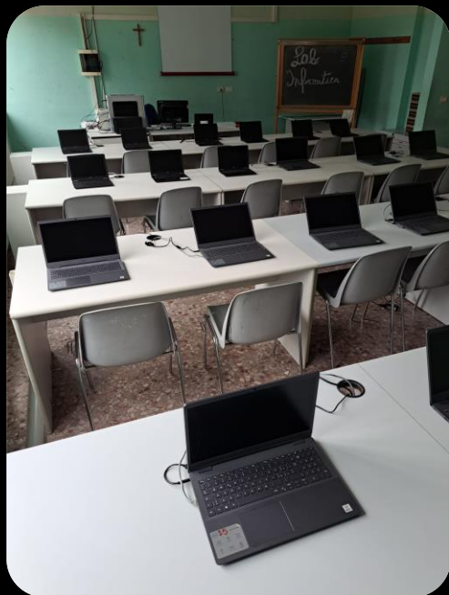
Aula di Informatica